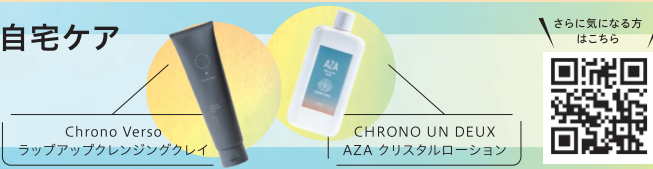
Chrono Verso ラップアップクレンジングクレイ

毛穴に悩みを抱えている方は油分の少ないジェルタイプクレンジングや、アゼライン酸など皮脂の分泌を抑制する成分が配合された化粧水を使用することで毛穴の開きを予防できます。